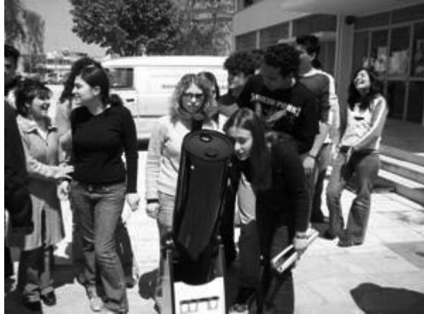
Μαθητές παρατηρούν τον Ήλιο

που είναι απαραίτητες για την παρατήρηση του ηλιακού δίσκου, και κατέγραψαν την μετατόπιση των ηλιακών κηλίδων από μέρα σε μέρα, παρατηρώντας άμεσα τη διαφορετική περιστροφή του Ήλιου.